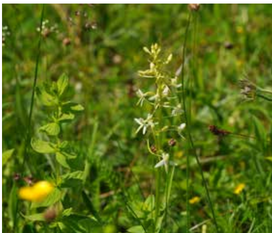
Den välluktande blomman Natt och Dag som vid midsommartid blommar runt Smedstorp, Fröseke.

Våraskröv ligger mellan Sävsjöström och Marshult, nordöst om Lenhovda. Ett besök i Våraskrövs naturresevat lämnar ingen oberörd. Den överdådiga ängsfloran med Adam och Eva, gullviva, slättergubbe, brudsporre, nattviol, ängs- och