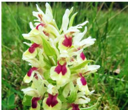
Skäraskogs egen och unika variant av Adam och Eva.

I Vitthults urskog finns döda träd i olika förmultningsstadiet, där vedsvampar och trädlavar som tagellav och garnlav växer. Marken är mager och få kärlväxter finns i resevatet. Arbete pågår för att bilda ett större sammanhängande naturresevat. I det området ska Vitthults urskog, naturresevatet Tängsjö fly samt Hjartsjön, som ligger strax väster om urskogen, ingå.