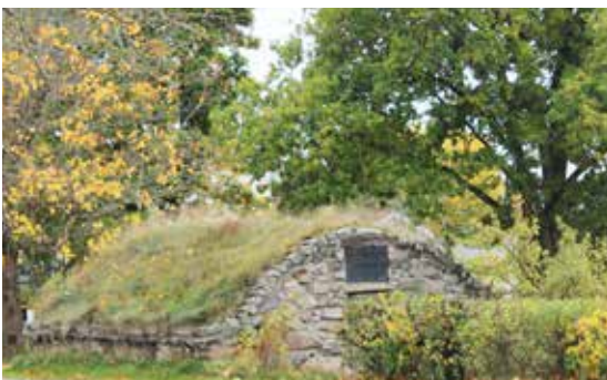
Tjuvakällaren, Lenhovda

Guidning av Tingshuset efter överenskommelse på telefon ..... 073-039 54 00