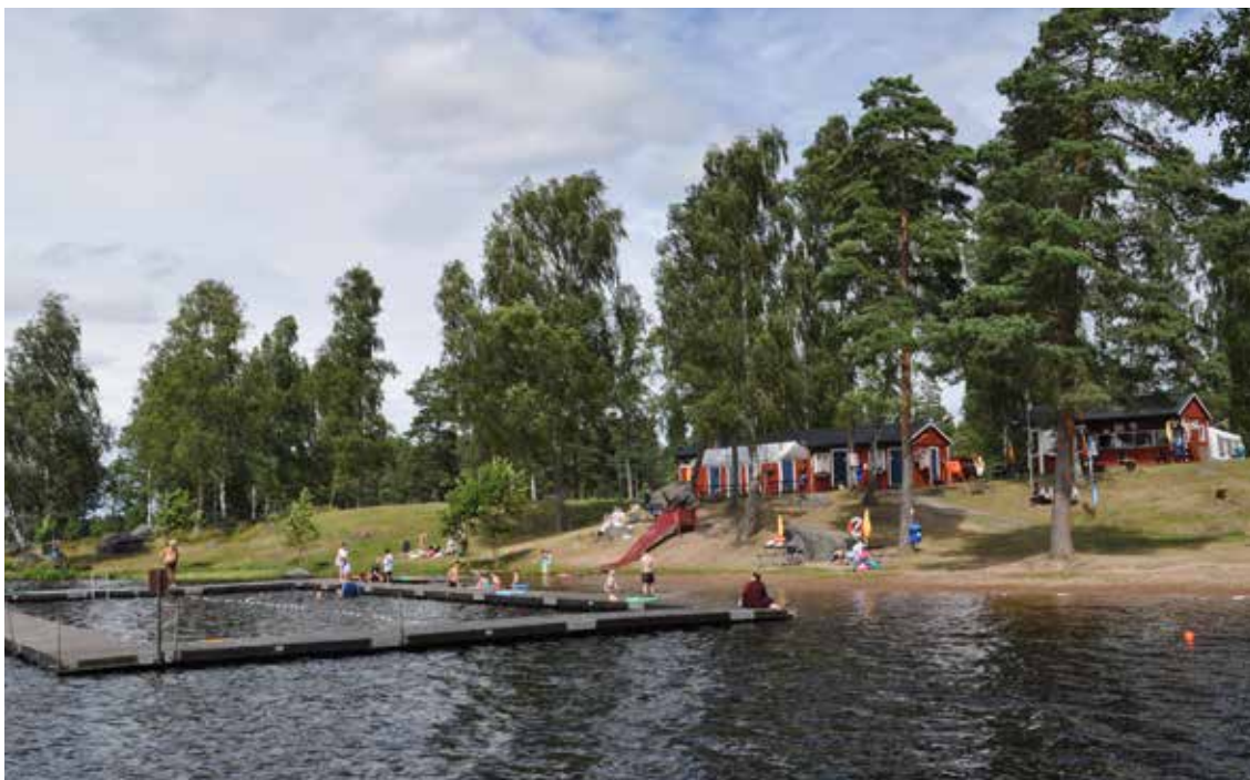
Strandbadet i Älgåhult.