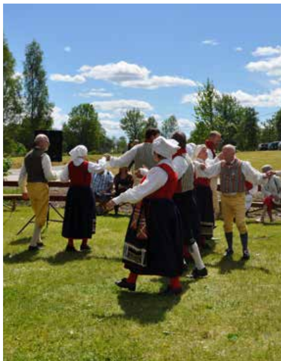
Midsommarfirande i Fröseke.