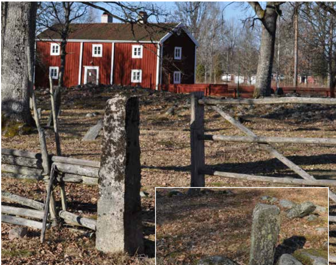
Lenhovda Hembygdsgård